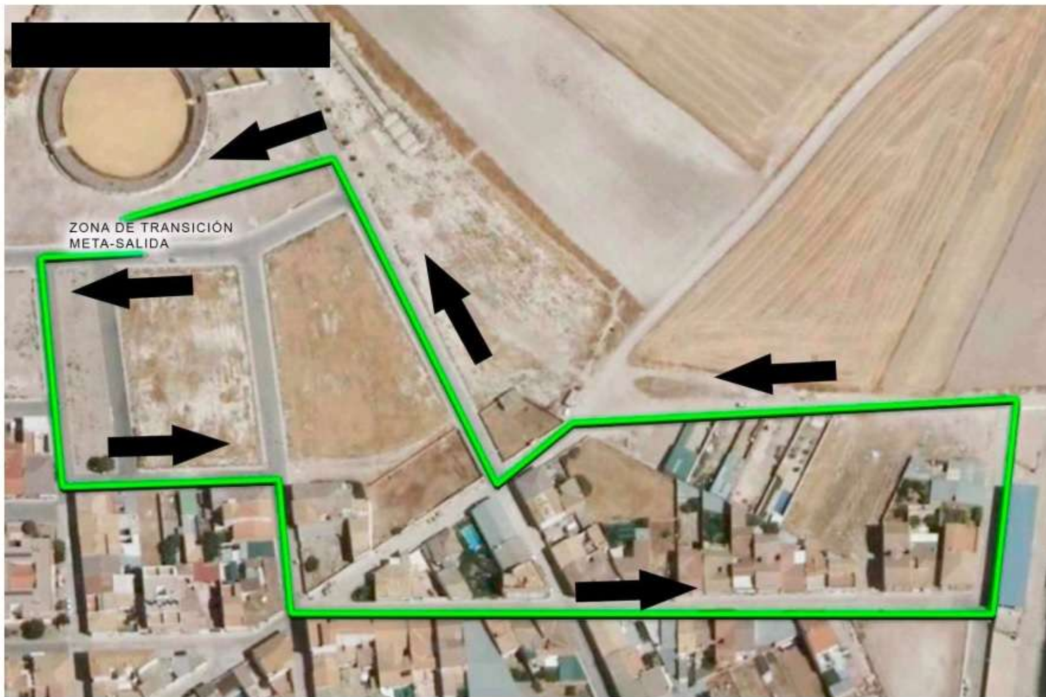
2° Segmento a Pie 1 km.( 1 vuelta)