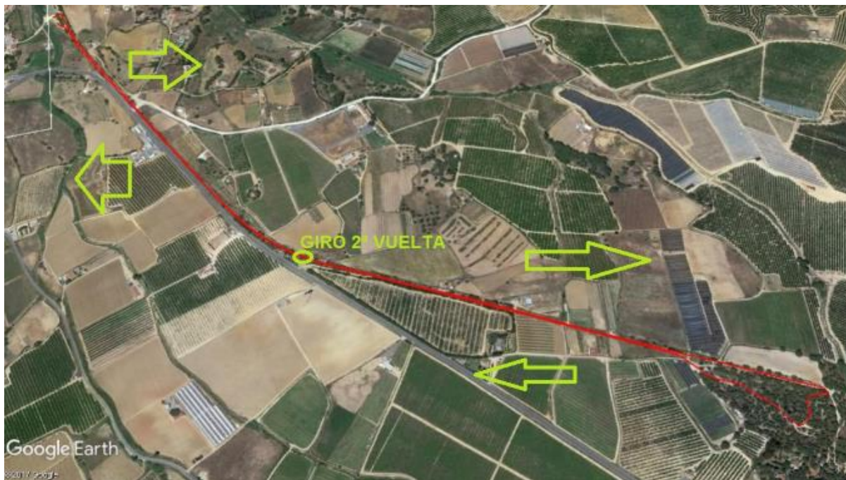
BICICLETA BTT 2 VUELTAS DE 4 KILOMETROS. 8 KILOMETROS TOTAL.