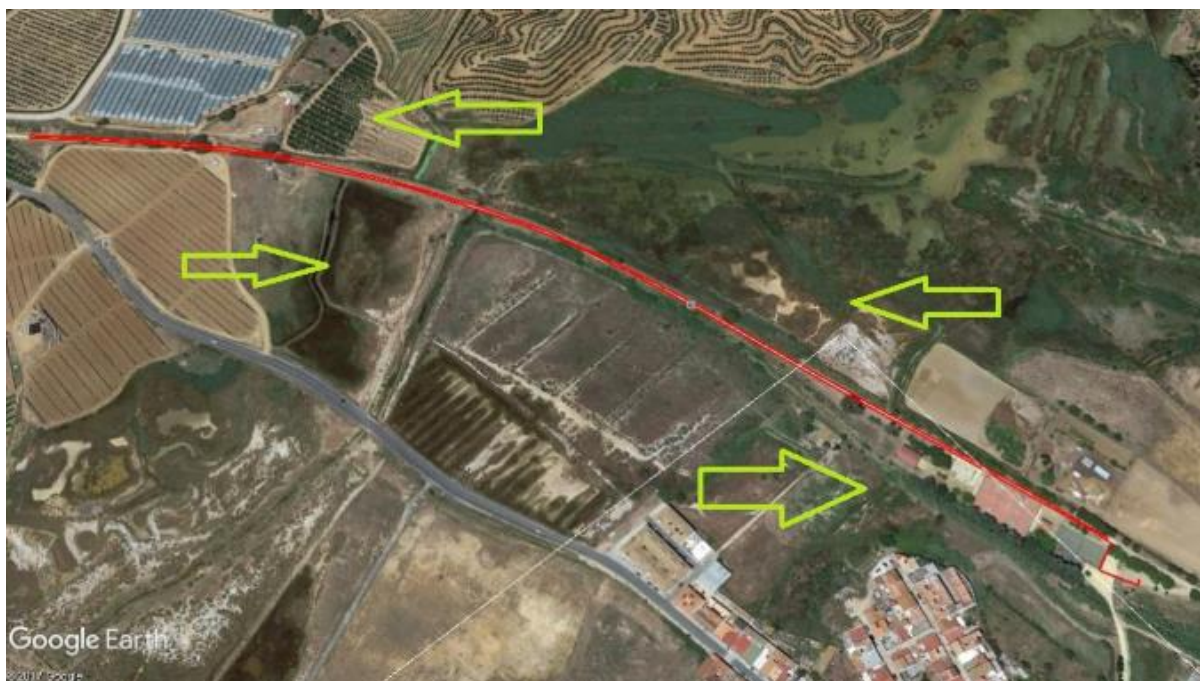
CARRERA A PIE 2 KILOMETROS.