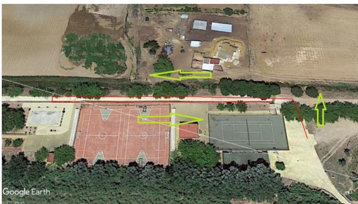
CARRERA A PIE SEGUNDO SECTOR 250 METROS.