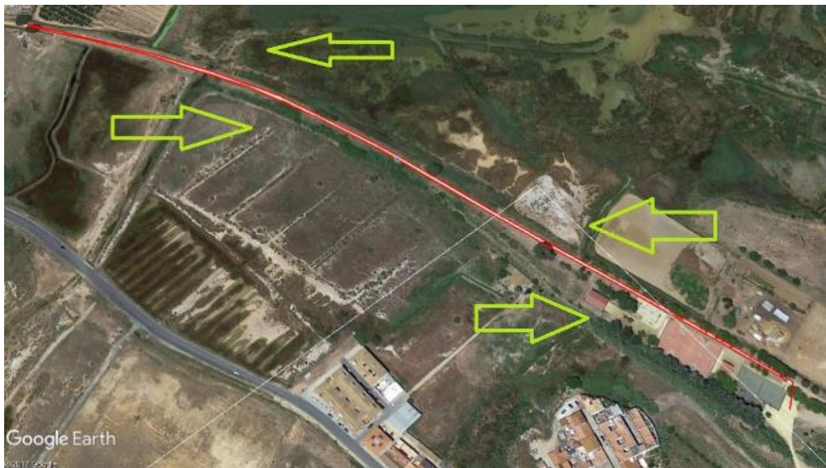
CARRERA A PIE SEGUNDO SECTOR 1'5 KILOMETROS.