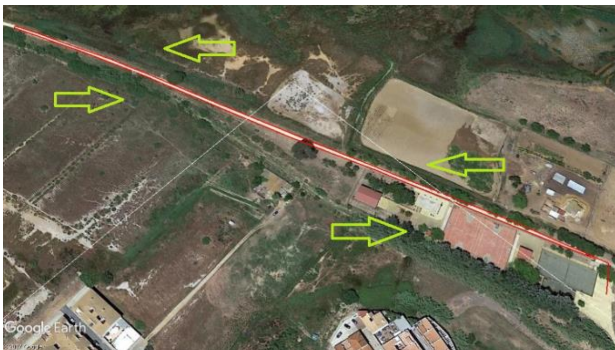
CARRERA A PIE 1 KILOMETRO.