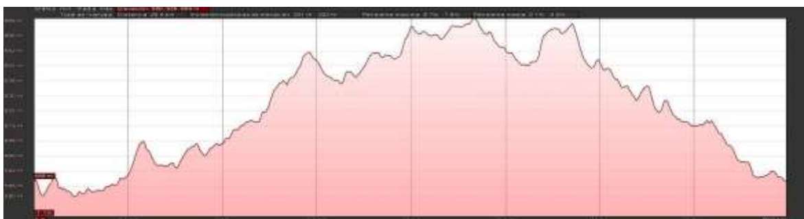
Perfil del circuito del sector BIKE BTT (Segmento 2 de la competición)