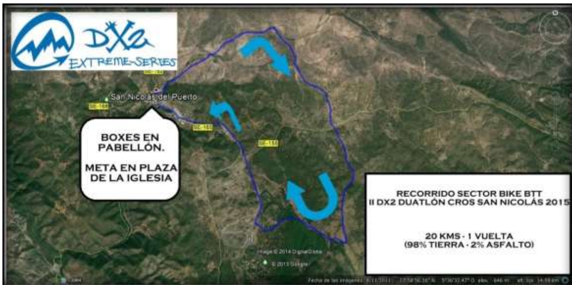
Plano aéreo al detalle del sector BIKE BTT (Segmento 2 de competición)

El Recorrido del segmento de Ciclismo BTT, discurrirá casi en su totalidad por caminos y veredas, en el entorno del Parque Natural Sierra Norte de Sevilla.