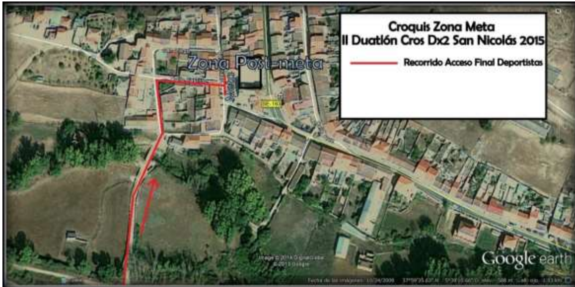
Ampliación zona meta