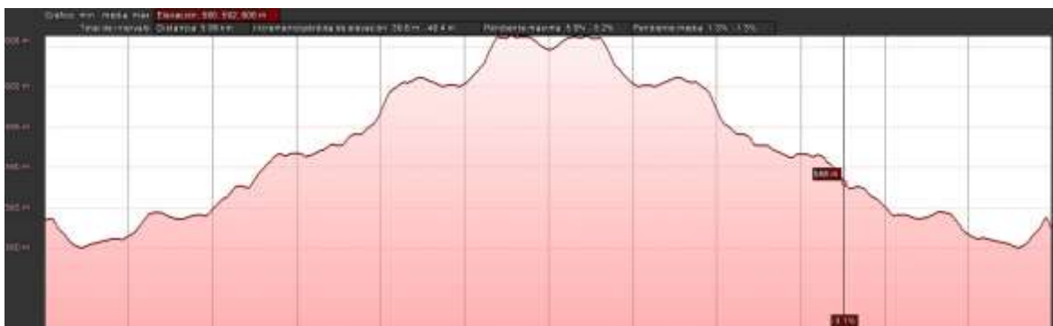
Perfil del circuito del sector RUN (Segmento 1 de la competición)