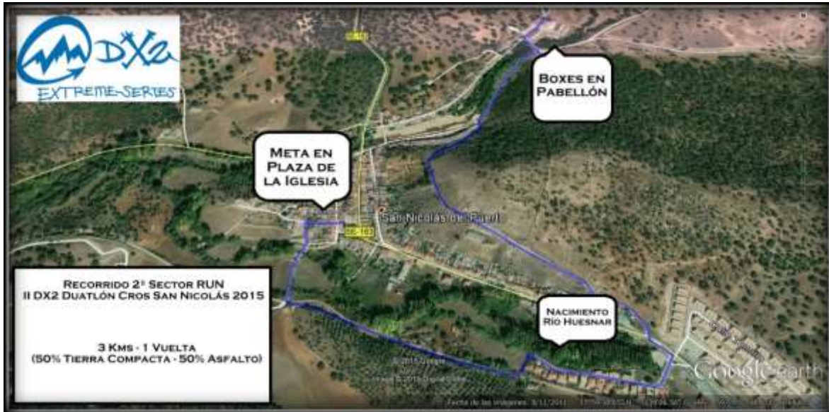
Plano aéreo al detalle del sector RUN (Segmento 3 de competición)