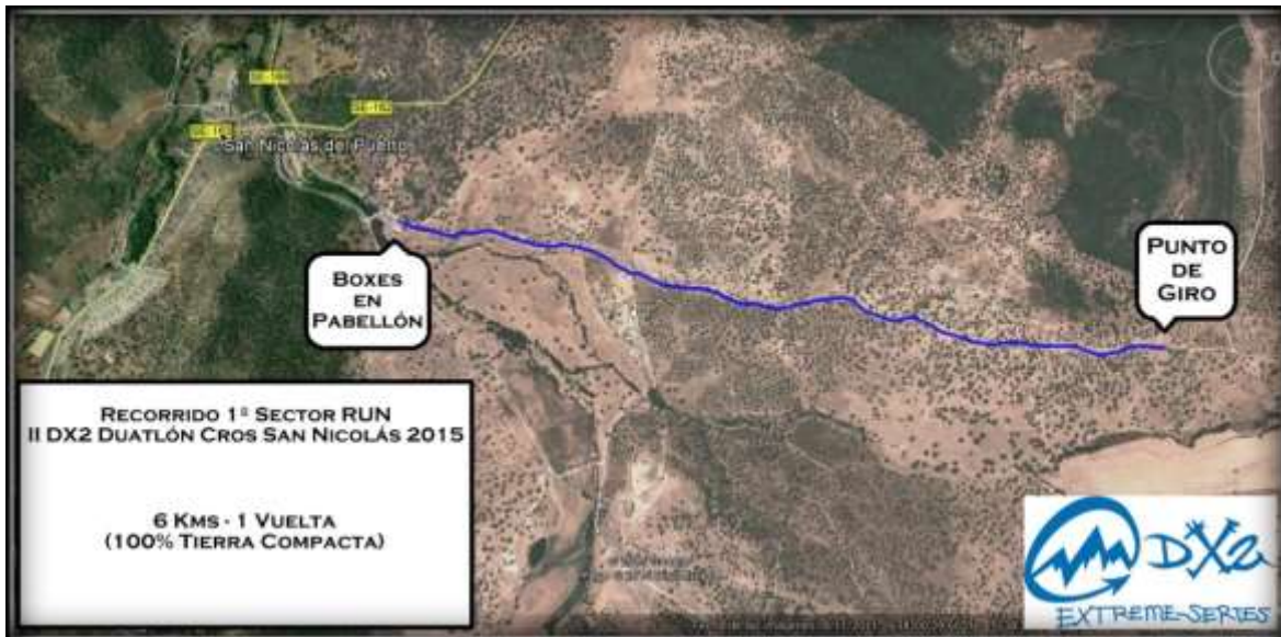
Plano aéreo al detalle del sector RUN (Segmento 1 de competición)

El Recorrido del segmento de Ciclismo BTT, discurrirá casi en su totalidad por caminos y veredas, en el entorno del Parque Natural Sierra Norte de Sevilla.