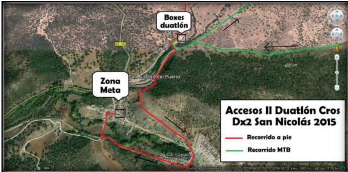
Accesos y ubicación de Zona Meta y Boxes