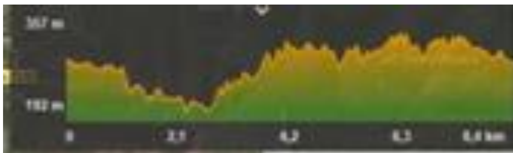
Perfil circuito btt 8 km

Enlace track circuito btt: https://es.wikiloc.com/rutas-mountain-bike/duatlon-cros-recorrido-mtb-14154070