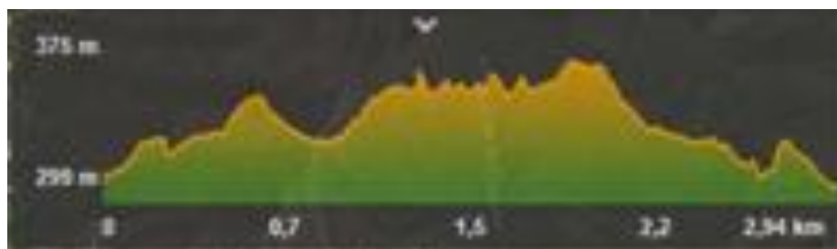
Perfil circuito a pie 3 km

Enlace track circuito a pie: https://es.wikiloc.com/rutas-carrera/duatlon-cros-recorrido-carrera-a-pie-14151989